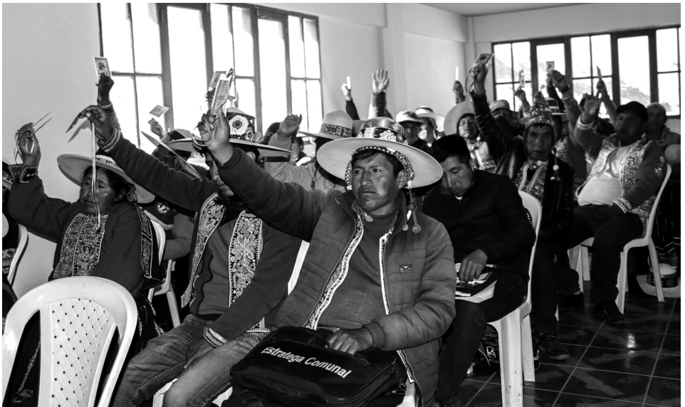
Aprobación del Estatuto de la Autonomía Originaria Challa