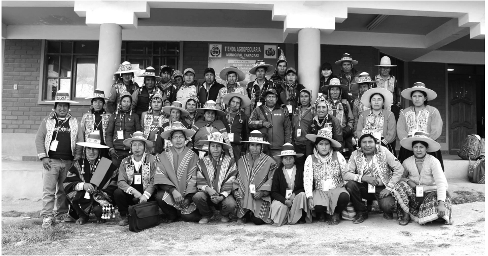
Miembros de la Asamblea Estatuyente de la Autonomía Originaria Challa